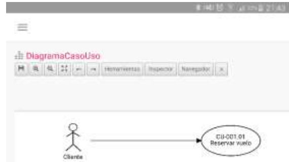
Figura 2. Visualización desde un dispositivo móvil

En la figura 1 se observa, a modo de ejemplo, el diseño conceptual de un caso de uso desde la herramienta CASE, que luego será visualizado desde un dispositivo móvil (figura 2).